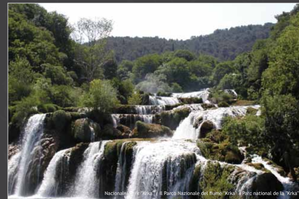
Nacionalni park Krka / Il Parco Nazionale del fiume "Krka" / Parc national de la "Krka"