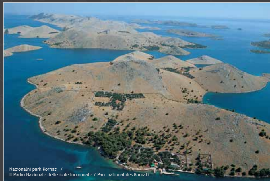
Nacionalni park Kornati / Il Parco Nazionale delle isole Incoronate / Parc national des Kornati

“Posljednjeg dana stvaranja svijeta Bog je želio okruniti svoje djelo i tako je stvorio Kornate prosušivši suze, zvijezde i uzdahe.”