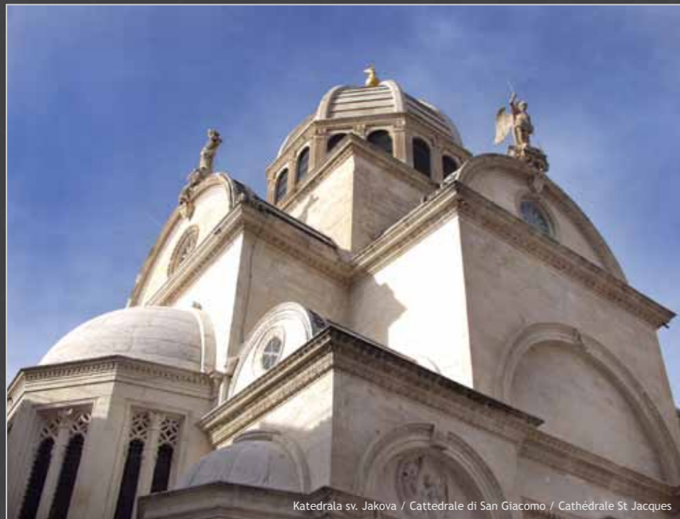
Katedrala sv. Jakova / Cattedrale di San Giacomo / Cathédrale St Jacques

S kradin i Šibenik, prijestolnice starohrvatskih kraljeva, stameni svjedoci slavne prošlosti, danas zrače svojom osobnošću.